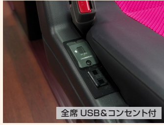
全席 USB&コンセント付