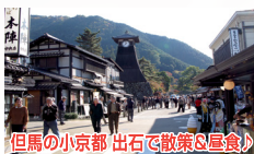
但馬の小京都 出石で散策＆昼食！