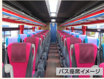
バス座席イメージ