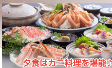
夕食はカニ料理を堪能♪

当ツアーは「地域一体となった観光地・観光産業の再生・高付加価値化 交通・観光連携型事業」認可を受け、香美町香住観光協会・但馬国出石観光協会・丹波市観光協会の協力をいただき運行するかにバスツアーです。