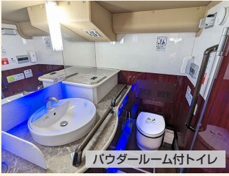
パウダールーム付トイレ