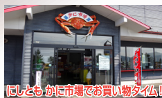
にしともかに市場でお買い物タイム！