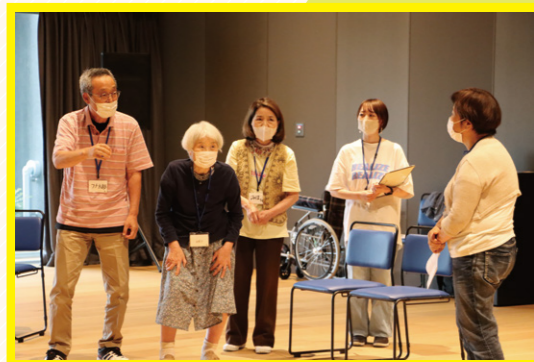
「老いのプレーパーク〜ワークショップ編〜」の様子

※稽古、岡山公演時の交通費は各自でご負担ください。三重公演時の交通費、宿泊費は劇場が負担いたします。