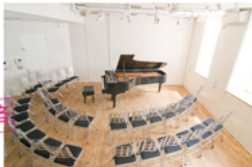
【Premium Concert for Kids [Mini] 会場】 自由が丘 オペラハウス Opera de JIYUGAOKA 50席

※プレミアムコンサートシリーズは、提携イベント・コンサートの次回公演チケットをお求めの方は、1,000円引きで入場可能。(おとな 5,500円/子ども 3,000円)