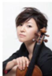
Violin Takako Ishii