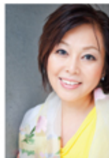
Soprano Tomoko Shibata