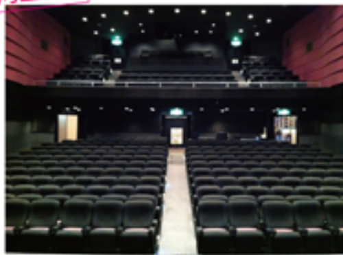
【Premium Concert for Kids 東京会場】 マウントレーニアホール (渋谷) McRAINER HALL 318席

※プレミアムコンサートシリーズは、提携イベント・コンサートの次回公演チケットをお求めの方は、1,000円引きで入場可能。(おとな 6,500円/子ども 4,500円)