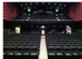
【東京会場】 マウンレーニアホール (渋谷) MOUNT RAINIER HALL 318席