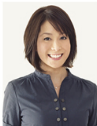
Attraction Navigator Kyoko Uchida

アトラクションナビゲーターは、ジャンルを問わず、コンテンツの奥深い魅力をひきだす絶妙なトークに定評がある人気ラジオパーソナリティ土屋滋生と、現在は仕事と育児を両立するフリーアナウンサーの内田恭子。二人とも父親と母親の代表として、キッズ向けコンサートのナビゲーターを担当。