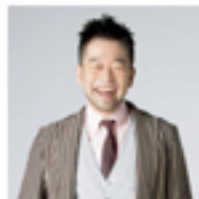
Singer Song Writer Noriyuki Makihara