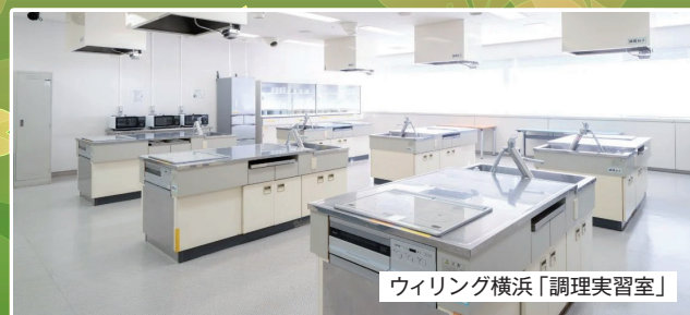
ウィリング横浜「調理実習室」

古くから「能登はやさしや土までも」と唄われています。大粒で旨みのある能登米をぜひご賞味ください。