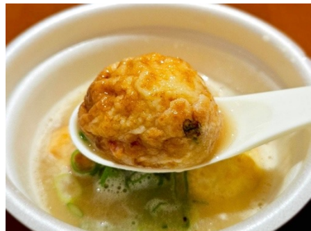
元天ねぎ蛸と相性抜群の豚骨スープ

スープタコシリーズ第1弾の豚骨スープは、福岡・天神の博多屋台発祥・ヒノマル食堂で提供されている博多とんこつラーメンスープとコラボ。1989年の創業以来、「スープ釜を空にすることなく注ぎ足す“呼び戻し製法”で味を極めた秘伝のスープです。シリーズ第2弾以降も有名ラーメン店やスープメーカーと協働し、味噌や魚介系スープなどとコラボする商品を提供予定です。