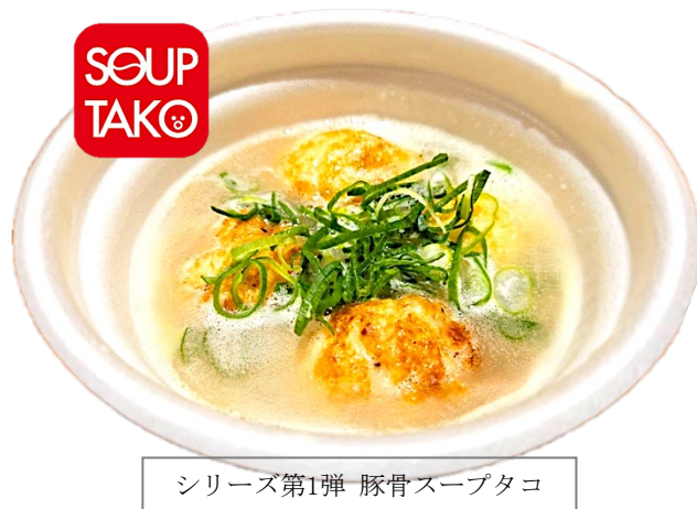
シリーズ第1弾 豚骨スープタコ

今回の豚骨スープタコはシリーズ第1弾商品。今後は季節ごとに新たなスープが登場予定です、元天ねぎ蛸のたこ焼きとの組み合わせをお楽しみいただけます。