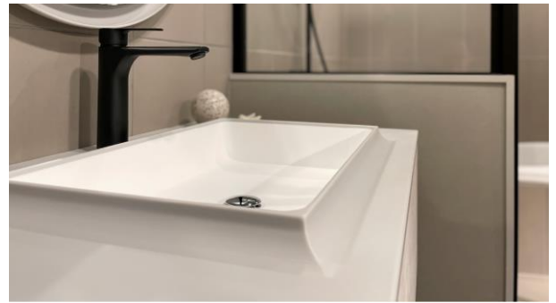
↑美しさと品質に優れた洗面ボウルを4種ラインナップ

スペインのメーカーAlvic(アルビック)社のメラミン化粧板「Zénit(ゼニット)」を採用。シルキーな質感で指紋が付きづらく、ニュアンスのある色展開が魅力です。