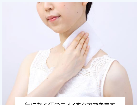
気になる汗のニオイをケアできます

シートは1枚ずつ取り出し、肌をふいてください。脇、首筋、腕、胸元、脚など全身にお使いいただけます。開封後はシールをきちんと閉め、なるべく早めに使い切りください。