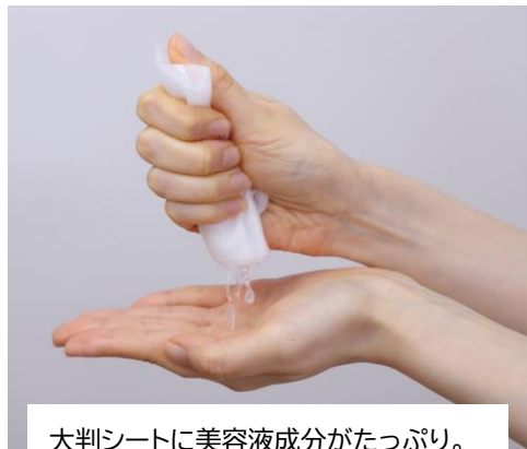
大判シートに美容液成分がたっぷり。 途中で乾かず1枚で全身を拭くことができます