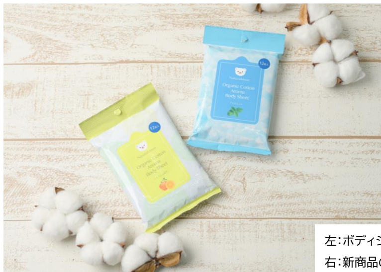
左:ボディシート(シトラス)／ 右:新商品のボディシート(アイスミント)

【購入サイト】 https://www.ngpls.jp/view/item/000000001436