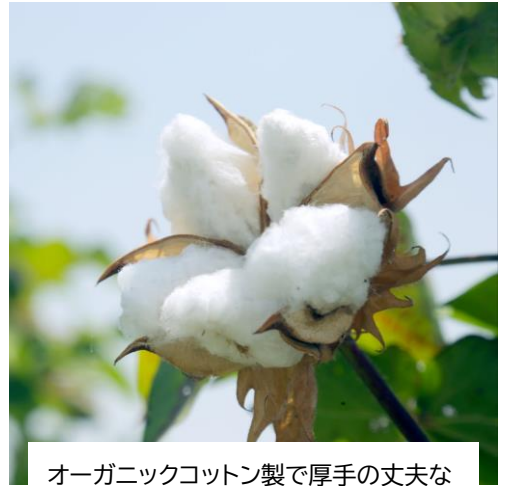
オーガニックコットン製で厚手の丈夫なシートを採用

製品開発を行うにあたり、SDGsの実現をめざした『人と環境にやさしいサステナブルな製品』づくりを強く意識しました。シートの原材料となるコットンにこだわり、無農薬で生産されたオーガニックコットンを採用しています。オーガニックコットンは生産過程において農薬を使わないため、農薬による生産者への身体負担、土壌環境への負荷がありません。また、包装資材のプラスチック使用量を低減するため外装袋を無くしています。外装袋にかかるコストを削減することで、できるだけお買い求めいただきやすい販売価格になるようにしました。