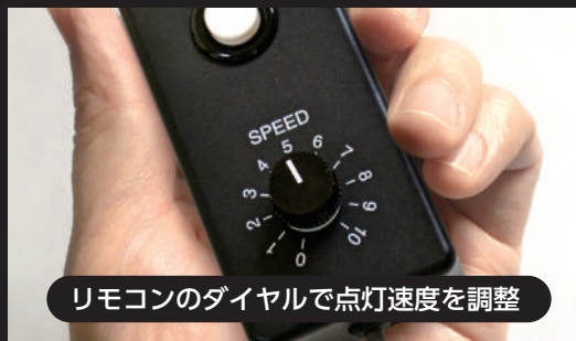
リモコンのダイヤルで点灯速度を調整