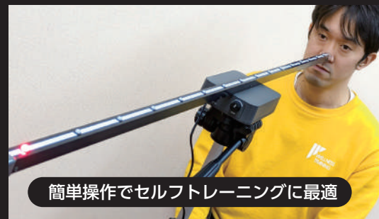
簡単操作でセルフトレーニングに最適