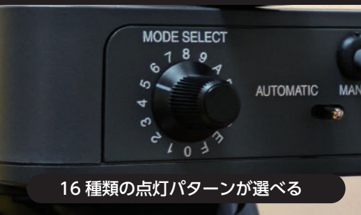
16種類の点灯パターンが選べる