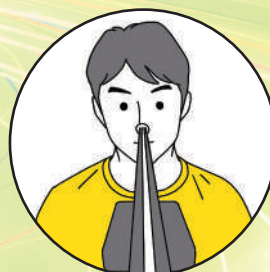
自宅・職場での セルフトレーニングに