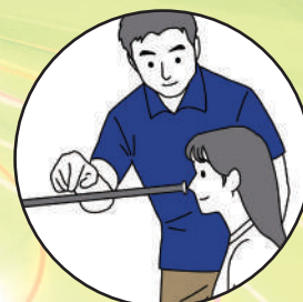
トレーニング施設での トレーナー指導に