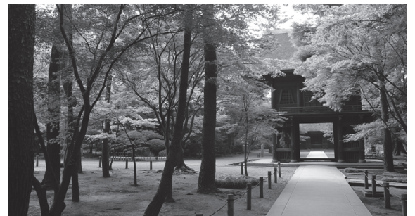
写真は平林寺（ http://www.heirinji.or.jp/ ）

集合場所：新座市民会館・第1会議室（埼玉県新座市野火止1-1-2） http://www.city.niiza.lg.jp/soshiki/44/shiminkaikan-info.html