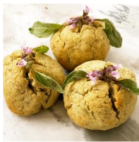
Holy Basil Scones ホーリーバジルスコーン 1個 350円（税込）

ホーリーバジルの花穂をひとつひとつ丁寧に摘み、フレッシュなままパックしました。ハーブティ、料理・お菓子にも使用。身体に優しいノンカフェインで、リラックス&デトックス、健康維持におすすめです。