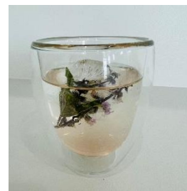
Holy Basil TEA アイスホーリーバジルコーディアル 350円（税込）

香り豊かなホーリーバジルをふんだんに混ぜ込み、米粉とキビ砂糖を使用した低糖・低カロリー・グルテンフリースコーン。