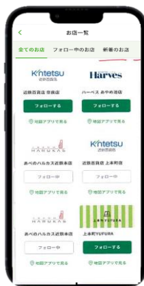
使えるお店一覧画面