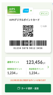
ポイントカード提示画面