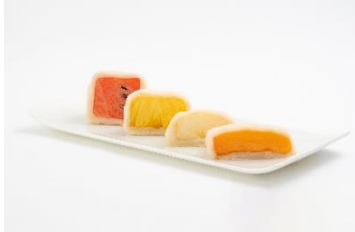
<覚王山フルーツ大福 弁才天>