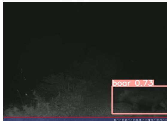
装置から約2mくらい離れた位置で検出