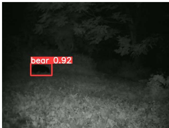
装置から約10mくらい離れた位置で検出