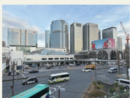
しながわえき 品川駅