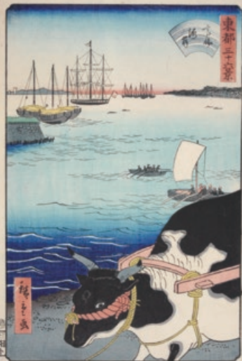
とうと さんじゅうろっけい たかなわかいがん 東都三十六景 高輪海岸