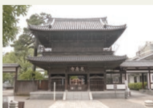
せんがくじ 泉岳寺