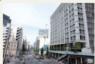
ふだ つじ 札の辻スクエア