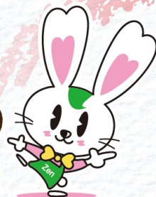
(公社)全日本不動産協会 公式キャラクター ラビーちゃん