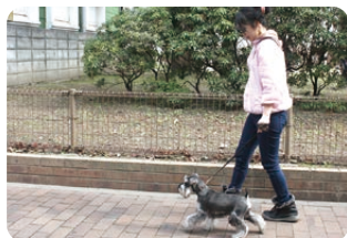
② 犬とお散歩することで「体力」が付き