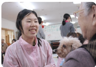
④ 犬を介することで「コミュニケーション能力」が付き