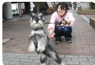
③ 犬に会いたくなるので毎日出勤する「習慣」ができ