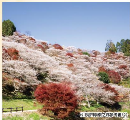
(川見四季櫻之郷參考圖片)

代表日本的紅葉著名景點、香嵐溪紅色和黃色的楓葉及在秋天盛開小原罕見的四季櫻，可欣賞此兩大絕佳景色的巴士之旅！