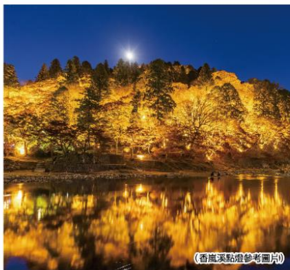
(香嵐溪點燈參考圖片)