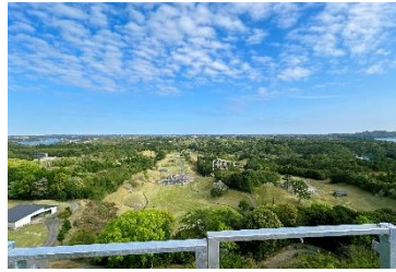
【スタート台からの眺望】

志摩グリーンアドベンチャー最高地点から高低差約50mを一直線に滑り降り、爽快感と開放感を楽しんでいただけます。