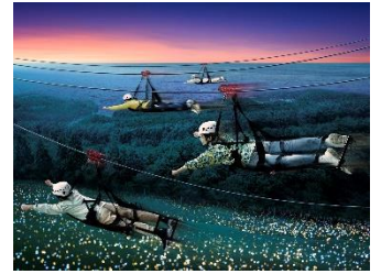
【ナイト★ジップダイブ】