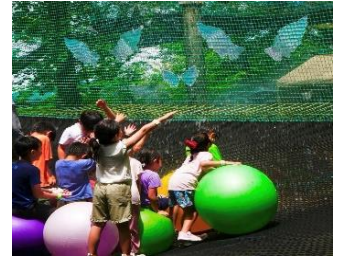
【フォレストジャンプ】