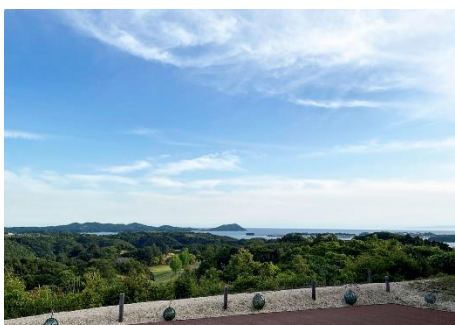
【展望デッキからの眺望】

各種チケットの購入、インフォメーション、レストラン、浴場の ほか、展望デッキも併設。