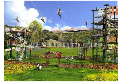
【クライミングタワー】