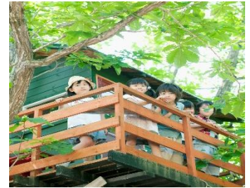
【ハーモニーハウス】