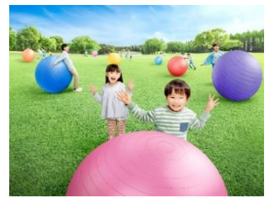
【マウンテンボール】