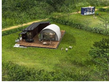
【ドッグラン付き棟】(6棟)