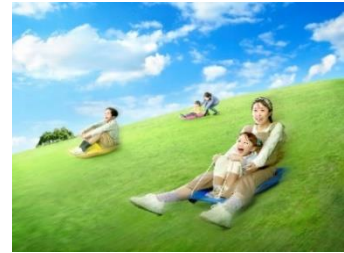
【グリーンスライド】