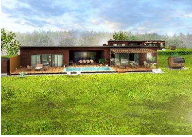
【ラグジュアリー棟】(2棟)

自分達だけの芝生、英虞湾の眺望、美しい夕日、満天の星など、伊勢志摩ならではの自然を存分に味わいながら、プライベートな時間を過ごすことができる贅沢な”空間”です。グランピングにご宿泊のお客様は、無料で「アトラクションフィールド」にご入園いただけます。(ワンちゃんは「アトラクションフィールド」へ入園できません。)