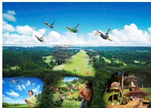
【アトラクションフィールドイメージ】

※1、2、4：2024年5月23日現在、当社調べ ※3：アスレチックタワー®は(株)SEアミューズメントの商標登録商品です