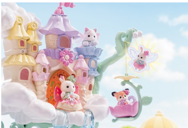
※2024年にフェアリーエリアが加わったシルバニアランド

●Webサイトはこちら→ https://whityumeda-campaign.jp