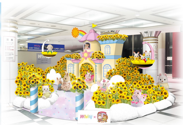
※サニーテラス装飾イメージ「ひまわり満開！お空のお城で妖精さんに会えるかな」