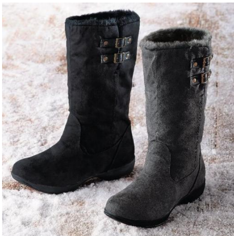
●美脚インヒールウィンターロングブーツ ¥9,800(税込) 左:ブラック、右:グレー

冬に映えるウォーム感のあるスエード調素材を使用、ブーツの筒部分の裏側と、取り外しができて且つ美脚効果を狙える2.5cmのインヒール部分には、ふわふわのボアを配して暖かさをキープします。履きやすいスナップ式開閉の履き口は、折り曲げても着用できる2ウェイタイプでコーディネート幅が広がります。さらに、水深4cmで6時間の浸水テストをクリアした防水設計が大きな特長で、急な雨や雪にも対応します。底も滑りにくい仕様で歩きやすく、冬のお出かけを快適にサポートします。サイズは、S（22.5～23cm）・M（23.5～24cm）・L（24.5～25cm）、色は、ブラックとグレーを展開します。