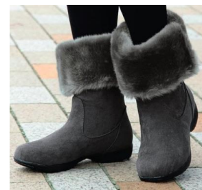
履き口折り曲げ時