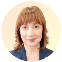
三重工熱株式会社 代表取締役社長