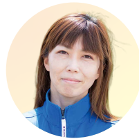
アース・クリエイト株式会社 執行役員総務部長

高校卒業後、大手電機メーカーへ入社。平成6年父親が経営する三重工熱へパート社員として入社。物作りの大切さを感じつつ、営業活動で様々な人と関わり、やりがいを見いだす。社長であった父が大病を患い、自分の立ち位置を改めて見つめる。人生の中で自分が社長になるとは全くの想定外だったが、平成23年社長のバトンを受け取る。