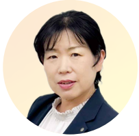
株式会社赤福名古屋営業所 所長

アースグループが運営する児童福祉でパートとして入社。正社員での就職を目指し、アース・クリエイト(有)に正社員として入社。育児休業中に保育士試験にチャレンジし、復職後、保育士試験合格。育児休業中のママさん中心の部署を設立し、企画制作室マネージャーに就任。その後、執行役員総務部長に就任。