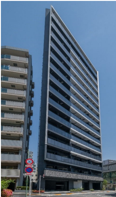
【ガーラ・ステーション大森海岸】

当社グループは、今後も上質なデザインを追求した外観やエントランス、安全性・快適性を重視した設備仕様など、居住者目線に立ったマンションの企画・開発を進めてまいります。