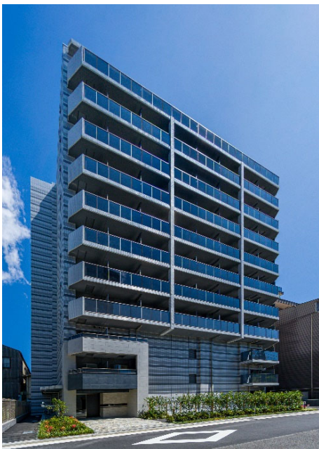
【ガーラ・ステーション東神奈川】