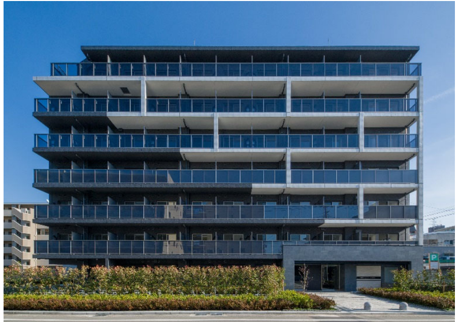
【ガーラ・ヴィスタ横浜鶴見】