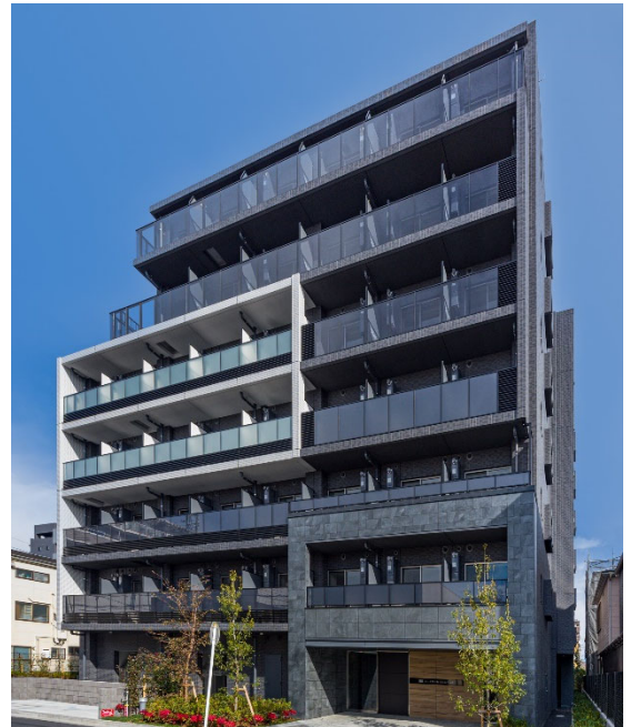
【ガーラ武蔵小杉グランドステージ】