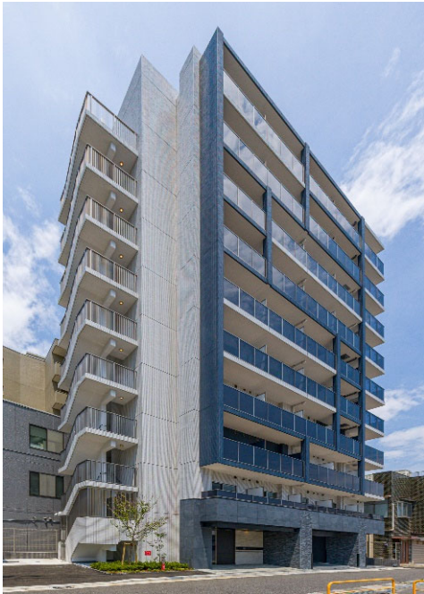
【ガーラ・クレスト川崎】