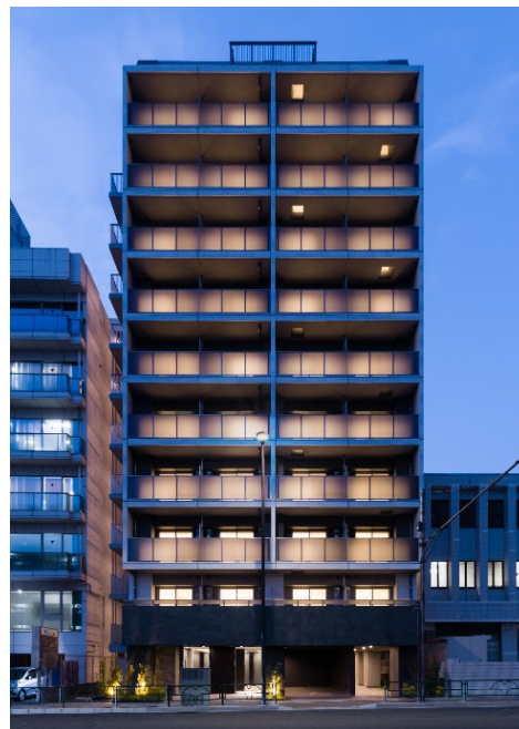
【ガーラ・グランディ木場公園】