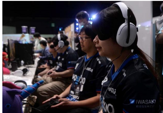
バリアフリー e-Sports 体験