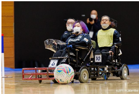
電動車椅子サッカー エキシビジョンマッチ&体験会

https://www.youtube.com/@hcrjapan/videos