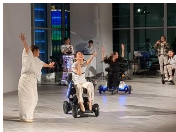
AI ロボット技術を使ったダンス支援システム 「スマーター・インクルーシブ・ダンス」 / 東北大学平田研究室

3日間の実展示会ならびに、いつでもどこでも福祉機器情報に触れられるよう、Web 展示会とのハイブリッド開催することで、より福祉が皆様の身近になることを期待しています。