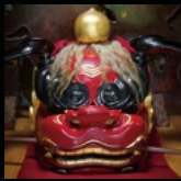
常陸獅子彫刻伝修館 (常陸獅子)