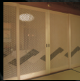
馬場先木工所 (いばらき組子)