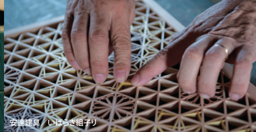
安達建具／いばらき組子