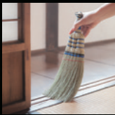
大穂箒協同組合 (大穂のほうき)