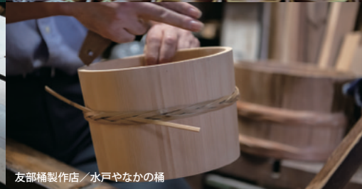
友部桶製造店／水戸やなかの桶