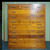
桐タンスのヤマキヤ (結城桐単笥)