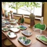
陶 梅田 (つくばね焼)