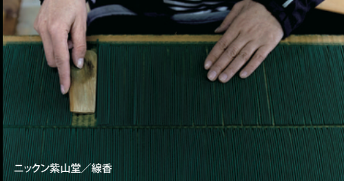
ニッケン紫山堂／線香