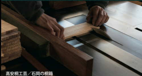
高安桐工芸／石岡の桐箱