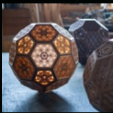
安達建具 (いばらき組子)