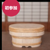
初参加 友部桶製造店 (水戸やなかの桶)