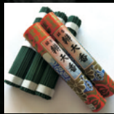
ニッケン紫山堂 (線香)