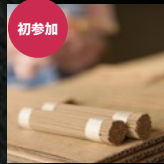
初参加 駒村清明堂 (線香)