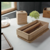
高安桐工芸 (石岡の桐箱)