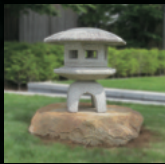
真壁石材協同組合 (真壁石燈籠)