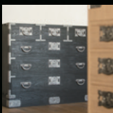
堀江桐タンス店 (結城桐単笥)