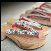
猪ノ原桐材木工所 (結城地方の桐下駄)