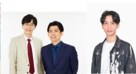
カベポスターさん