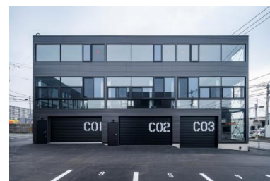
【ガレージハウス事例】

今後は新たに、賃貸マンションの供給が多いエリアでも競争力ある賃貸事業として、賃貸ガレージハウスや賃貸店舗をご提案して参ります。