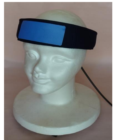
頭部・超音波刺激ヘアーバンド