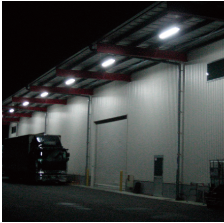
▶ 物流倉庫 屋外