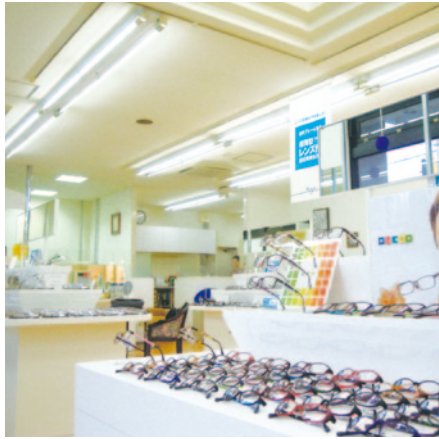
▶ ロードサイドショップ