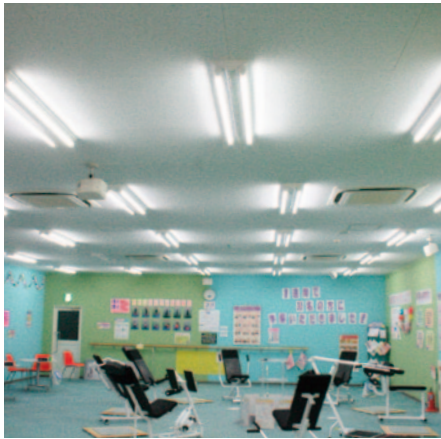
▶ フィットネスクラブ