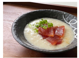
あえてマグロの赤身にかけて旨さ倍増!