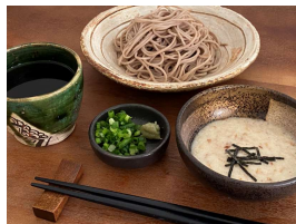
つけとろ蕎麦におそばにかけて