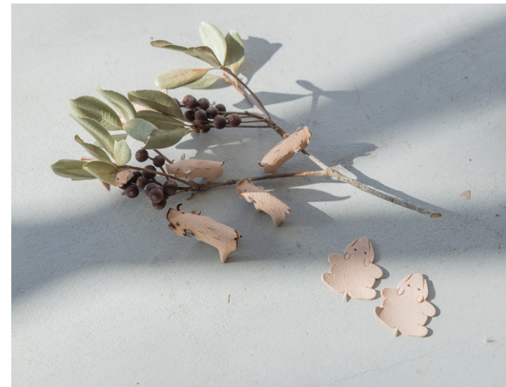
ワークショップ製品