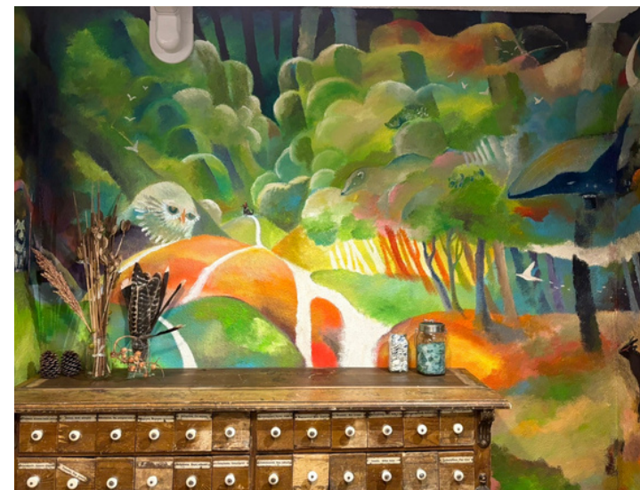
アート/インテリア アコーディネート