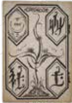
『草土社第3回美術展覧会目録』(岸田劉生装画) 1916年 当館