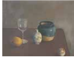
「静物」清宮彬 1922年 東京都現代美術館