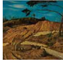
「赤土の山」椿貞雄 1915年 当館