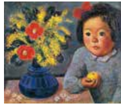
「彩子とミモザ」椿貞雄 1954年 当館