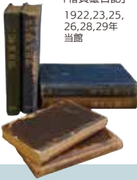
「椿貞雄日記」 1922,23,25, 26,28,29年 当館