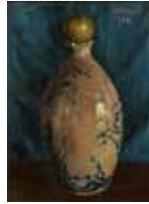
「壺の上に林檎が載っている」岸田劉生1916年 東京国立近代美術館