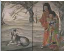
「春夏秋冬四屏風(春)」椿貞雄 1931年 千葉県立美術館