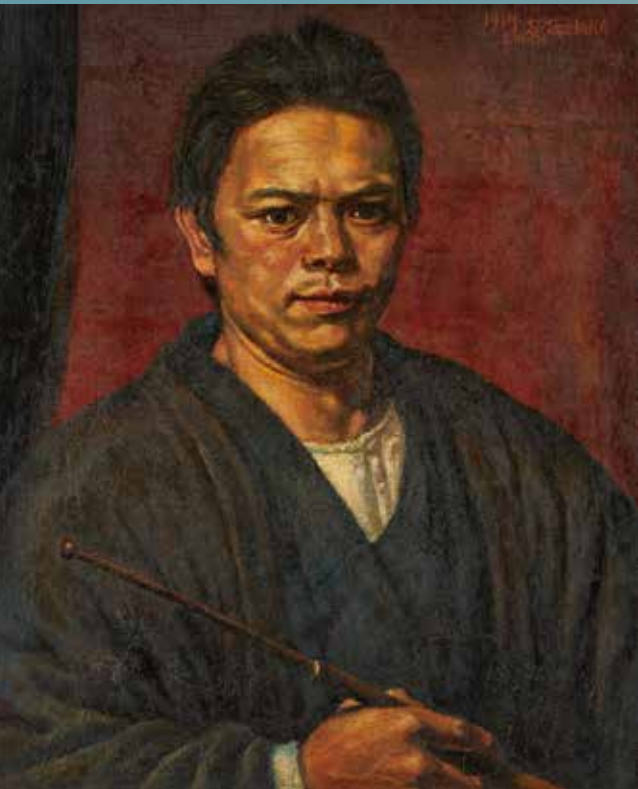
「腕鎧を有する自画像」 椿貞雄 1917年 油彩・キャンバス 東京国立近代美術館蔵