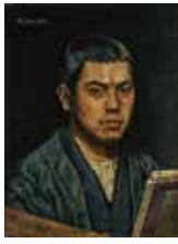
「自画像」椿貞雄1915年 千葉県立美術館