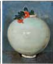
「壺(白磁大壺に椿)」椿貞雄 1947年 当館