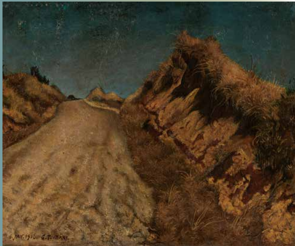
「冬枯れの道」 椿貞雄 1916年 油彩・キャンバス 東京国立近代美術館蔵