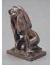
「小さなスフィンクス」ロダン 武者小路実篤コレクション 東京都現代美術館