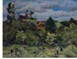
「樹の下に遊んでいる子供」木村莊八 1915年 福島県立美術館