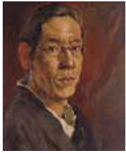
「自画像」岸田劉生1914年 福島県立美術館