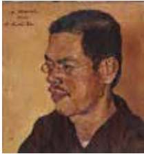
「武者小路実篤像」岸田劉生 1914年 東京都現代美術館