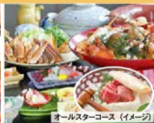
オールスターコース (イメージ)