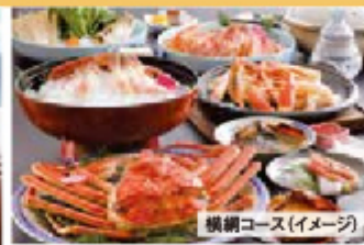
横綱コース(イメージ)