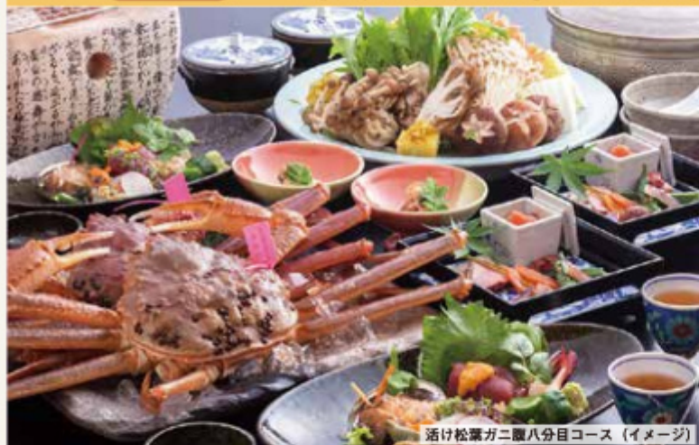
活け松葉ガニ腹八分目コース (イメージ)