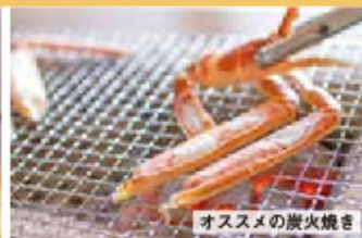
オススメの炭火焼き