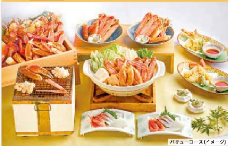
バリューコース(イメージ)