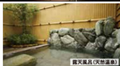
露天風呂(天然温泉)