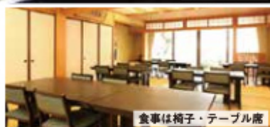
食事は椅子・テーブル席