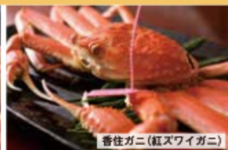
香住ガニ(紅ズワイガニ)