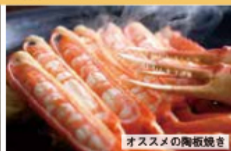
オススメの陶板焼き