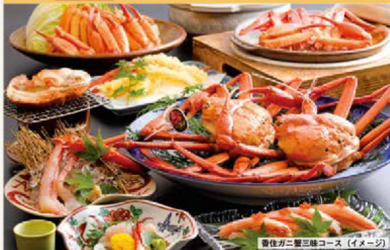
香住ガニ蟹三昧コース (イメージ)