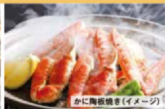
かに陶板焼き(イメージ)