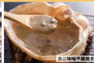
カニ味噌甲羅焼き