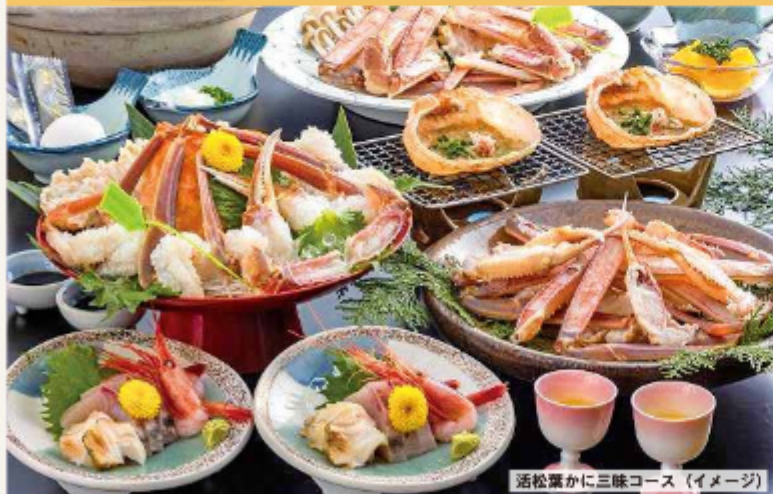
活松葉かに三昧コース (イメージ)