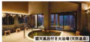
露天風呂付き大浴場(天然温泉)