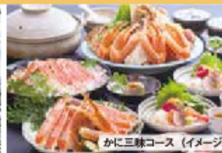
かに三昧コース (イメージ)