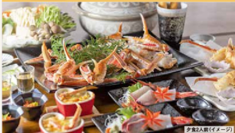
夕食2人前(イメージ)