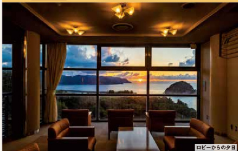
ロビーからの夕日