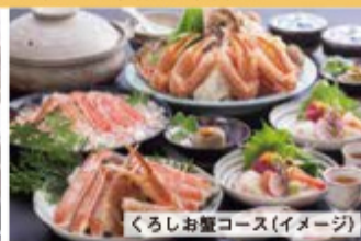
くろしお蟹コース (イメージ)