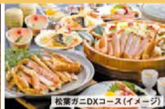
松葉ガニDXコース(イメージ)