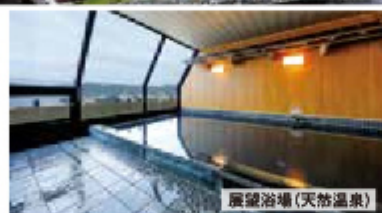
展望浴場(天然温泉)