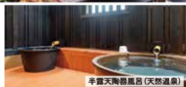
半露天陶器風呂(天然温泉)