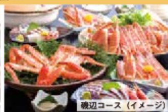
磯辺コース (イメージ)