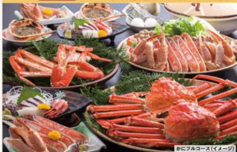
かにフルコース(イメージ)