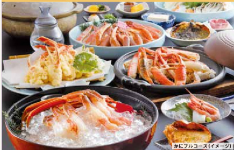
かにフルコース(イメージ)