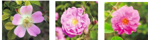
＜ミッシェルピオに使われている3種類のローズ＞ 左から順に、ワイルドローズ(ローズヒップ)、 ケンティフォーリアローズ、ダマスクローズ

世界中のバラから選んだ3種類のオーガニックローズを使ったスキンケアシリーズの“ミッシェルピオ”。自然由来の原料を使用しながら、使用感もあり、肌にも環境にもやさしいのが特徴で、商品の豊かな香りと心地よいテクスチャーが魅力的なアイテムです。