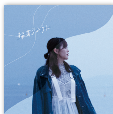
配信シングル 「揺蕩うように」 2024年11月30日