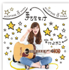
1stシングル 「手をたたけ」 2016年1月29日