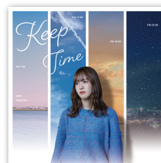
2ndミニアルバム 「Keep Time」 2022年12月3日