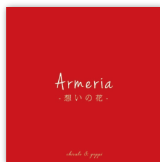
配信シングル 「アルメリア-想いの花-」 2020年6月