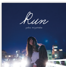
1stミニアルバム 「Run」 2020年2月22日