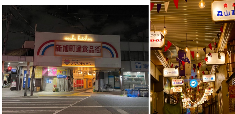
■空き区画の多かった「新旭町通食品街」の区画