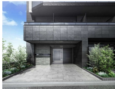
【エントランスイメージ】