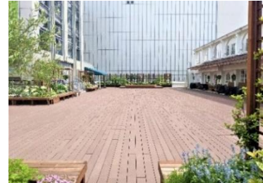
[A 館 3 階屋外スペース「GREENING 広場」]