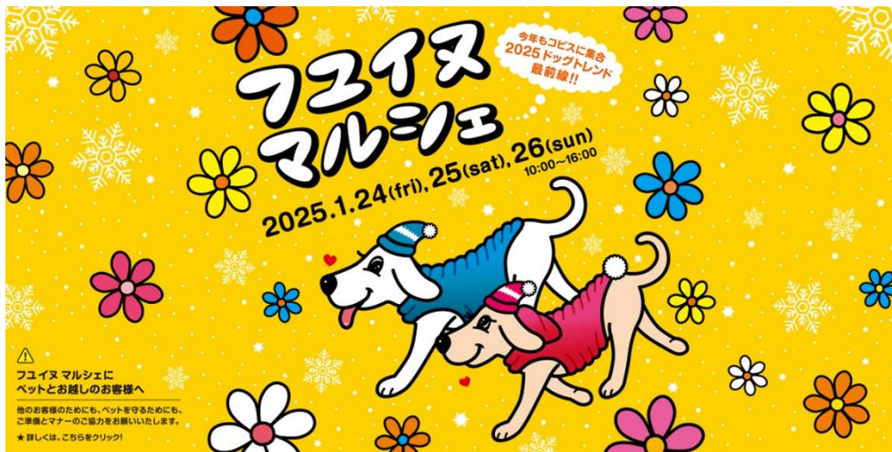
<イベントキービジュアル>

コピス吉祥寺(所在地:東京都武蔵野市)は、2025年1月24日(金)～1月26日(日)の3日間、『フユイヌマルシェ 2025』を開催いたします。本イベントは2022年より毎年開催しており、たくさんの愛犬家の方にご好評いただいています。今年4回目の開催となる「フユイヌマルシェ 2025」は、メイン会場となる屋外スペースの GREENING 広場で、約 20 店舗のドッグトレンド最前線の商品が集まるマルシェを開催。1 階コンコースやベニーレーンでも、わんこ好きの心を掴むグッズを集めたフユイヌ・ミニマルシェをおこないます。館内ではわんここと入れるエリア『わんこウェルカムエリア』を拡大。コピス吉祥寺の各所でわんここと一緒にお買物を楽しめる3日間です。