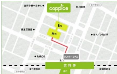
[コピス吉祥寺アクセス MAP]