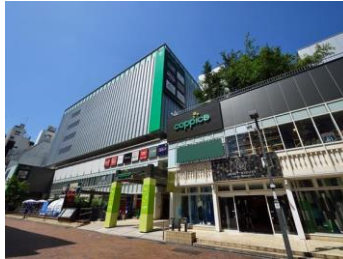
[コピス吉祥寺外観]