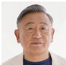
株式会社フォース・マーケティング アンドマネージメント 代表取締役CEO