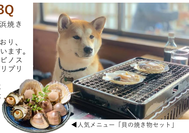
◀人気メニュー「貝の焼き物セット」

HP： https://hamachaya-amimoto99.com/#top