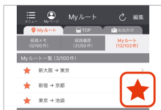
▲よく使う駅・経路の入力がカンタンに