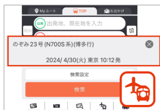
▲乗りたい便を指定して検索