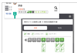
▲号車単位でわかる詳細な乗車位置表示