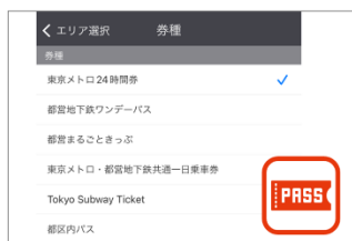
▲100券種以上のフリーパスエリア内検索