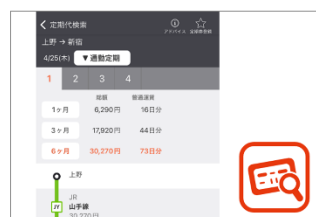
▲定期代検索とのりこし精算