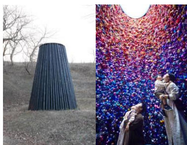
「ぼっかりあいた穴の秘密」 / 増田 セバスチャン