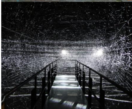
「Analemma (アナレンマ)」 / 千田 泰広 ※2025年秋イベントで再登場予定