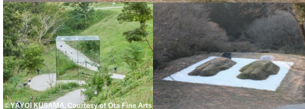
©YAYOI KUSAMA