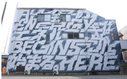
「全てのエネルギーはここから始まる」 / 八木 秀人 ※2027年6月頃まで展示予定

所在地：市原市牛久（牛久商店街） / HP： https://ushikuredesign.com/index.html