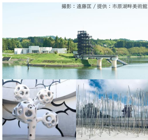
(上) 市原湖畔美術館 (左下) 「Heigh-Ho」 / KOSUGE1-16 (右下) 「MUSEUM-STAIRS/ROOF OF NEEDLES&PINS」 / アコンチスタジオ