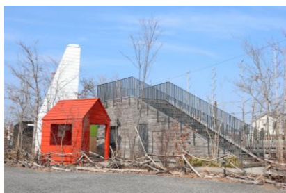
「里山トイレ」 / 藤本 壮介