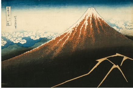
※きっかけとなった富嶽三十六景 山下白雨