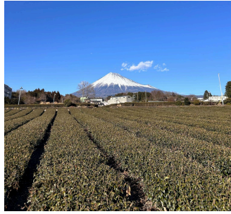
※みたて茶会の会場予定の 富士山の見える茶畑からの写真