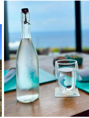
ご提供いただく製品 "みずのみず" 19:03 for Lounge & Hotels"