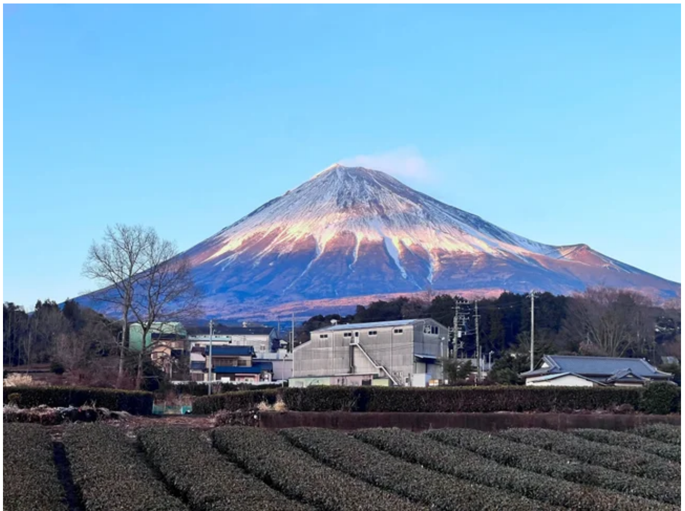
みたて茶会実施予定の茶畑

静岡県のお茶産業の活性化へ～富士の抹茶で地域と未来を結ぶ～ - 株式会社EN.主催、2/23(日)富士山の日に開催