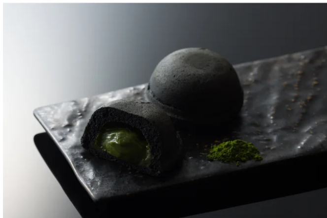
田子の月新商品”黒富士”