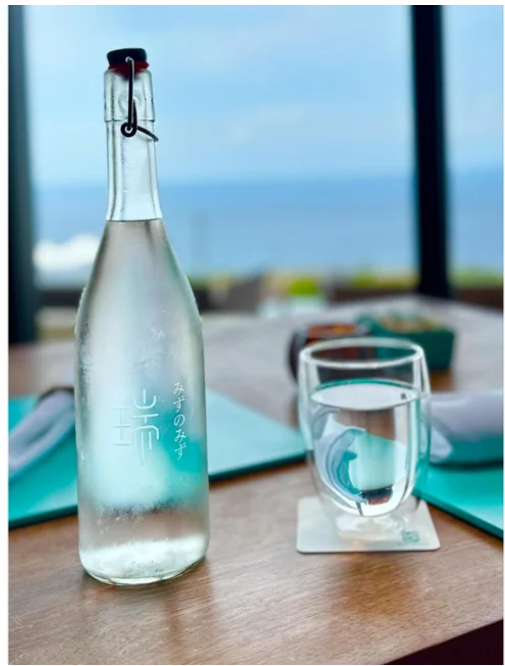
みずのみず（株）様からご提供いただく製品”みずのみず 19:03 for Lounge & Hotels”