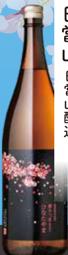
日當山 日當山醸造