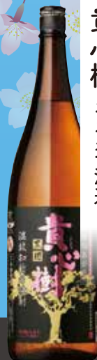
貴心樹 オガタマ酒造