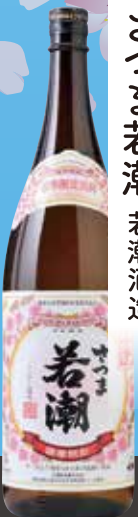
さつま若潮 若潮酒造