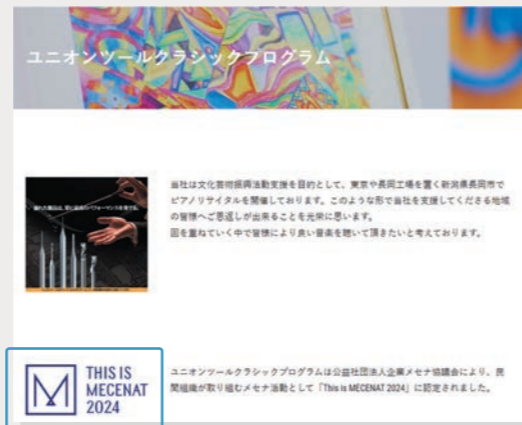
▲ 企業ホームページや株主通信などにメセナマークを掲載しています。