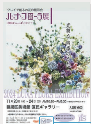
▲ 展覧会ポスターやニュースリリースなどにメセナマークを使用しています。