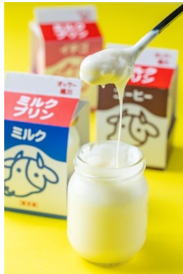
のびてオッケー ミルクプリン 480円 いちごみるくプリン/ コーヒープリン 各520円 (アレルギー：乳成分・卵・ゼラチン・大豆)