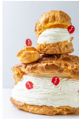
オッケーミルクシュー 320円 オッケーミルクシュー ビッグ 1,850円 オッケーミルクシュー メガジャンボ 11,369円 (アレルギー：乳成分・卵・小麦・大豆)