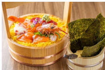
桶まる海鮮丼 1,958円 (アレルギー：えび・卵・小麦・さけ・いくら・大豆)