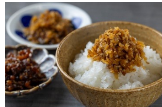
深谷ねぎ肉味噌 681円 醤油おかずダレ 各種 789円～