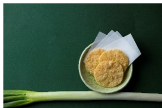
深谷ねぎの海老揚げ煎餅(8枚) 918円