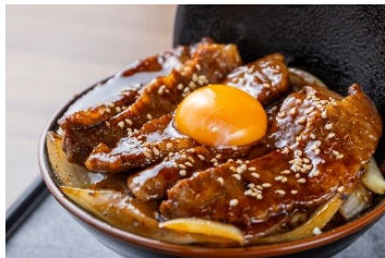
【武州和牛】牛焼き肉丼定食 2,398円 (アレルギー：卵・小麦・乳成分・牛肉・ごま・大豆)