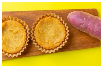
埼玉豊作すいーとぼてと(1個) 281円～