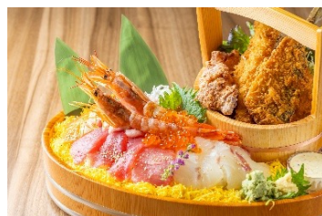
わっしょい贅沢桶囲み丼 6,050円 (アレルギー：卵・えび・小麦・鶏肉・さけ・いくら・いくら・ごま・大豆・りんご) ※本製品に使用しているしらすはえび・かに・いかが混ざる漁法で採取しています