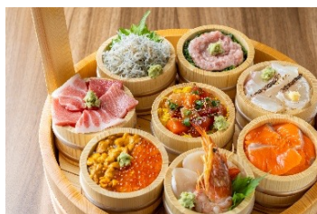
オッカー桶祭り丼 8種祭り 6,050円 (アレルギー：えび・小麦・さけ・いくら・ごま・大豆) ※本製品に使用しているしらすはえび・かに・いかが混ざる漁法で採取しています