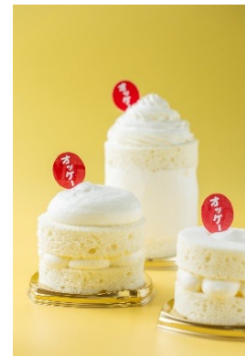
ミルクパンケーキサンド 600円 ミルクパンケーキサンド クリーム 680円 ミルクパンケーキサンド ビッグ 1,000円 (アレルギー：乳成分・卵・小麦・ゴマ)

【本棟南側・物販エリア】生ドーナツや総菜パン、菓子パンなどを扱うベーカリーも登場