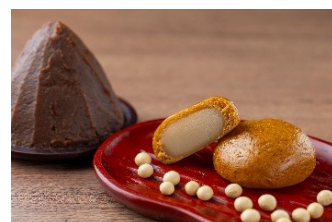
埼玉味噌まんじゅう 843円