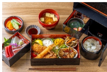
べに花の郷 宝箱御膳 3,058円 (アレルギー：えび・小麦・卵・乳成分・豚肉・鶏肉・ゴマ・大豆・サバ)