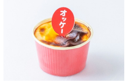
焼きたて オッケーバスク 400円 (アレルギー：乳成分・卵・小麦・大豆)