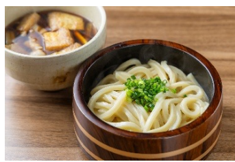
肉汁つけうどん 968円 (アレルギー：小麦・豚肉・大豆・さば)