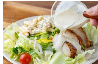
埼玉ミルクドレッシング 735円