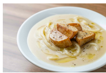
里芋ポターージュうどん 1,408円 (アレルギー：小麦・乳成分・豚肉・鶏肉・ごま・さば)