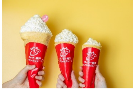
オッケーミルククレープ 800円 生クリーム盛り 1,000円 ミルクマウンテン 1,300円 (アレルギー：乳成分・小麦・卵・ごま・アーモンド・大豆・ゼラチン) ※クレープはベリー・キャラメルナッツ・いちごショート・チョコバナナなど各種フレーバーをご用意