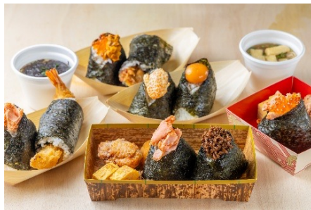
おにぎりとおかず満足セット 935円 【選べるおにぎり1個・唐揚げ・卵焼き・漬物・みそ汁付き】 おにぎり2個とおかず御馳走セット 1,265円 【選べるおにぎり2個・唐揚げ・卵焼き・漬物・みそ汁付き】