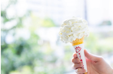
べに花の郷おけがわミルクソフト 420円 (アレルギー：乳成分・小麦・大豆)

・メニュー一例 ※価格は税込価格（10%）となります。テイクアウトの場合は8%の税率が適用されます。