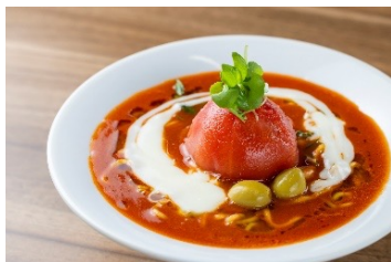
男気 とまと〜麺 1,738円 (アレルギー：小麦・乳成分・卵・豚肉・鶏肉・さば・大豆・りんご)

・メニュー一例 ※価格は税込価格（10%）となります。内容は変更となる場合がございます。