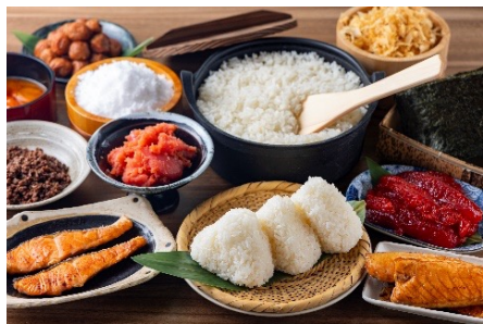
具材の一例 ・塩むすび 198円 ・ごま高菜にぎり 286円 ・ねぎ味噌にぎり 308円 ・焼き鮭にぎり 319円 ・【武州和牛】牛肉そぼろにぎり 330円 ・【武州和牛】卵黄肉そぼろにぎり 330円

・メニュー一例 ※価格は税込価格（10%）となります。内容は変更となる場合がございます。