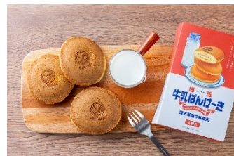
牛乳ぱんけーき(4個) 864円