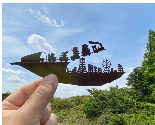
「葉っぱの小旅行 in みなとみらい」