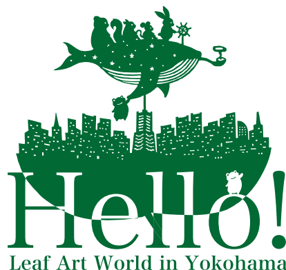
新作「行き先は潮風の吹くまま、気の向くまま」