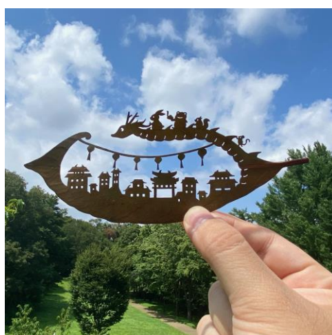
「葉っぱの小旅行 in チャイナタウン」