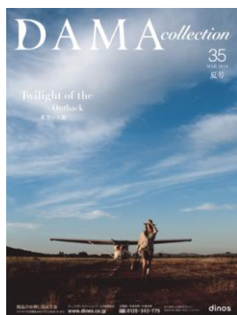
ダーマ・コレクション2014 夏号表紙