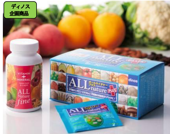
ディノス 企画商品

29種類の野菜や果物を、皮や葉まで丸ごと使用した、100%自然由来の素材を食事に近いカタチで補給。