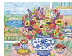
「サニーモーニングビュー」

内容 「花の画家」として知られ世界中にファンを持つ、レスリー・セイヤー。油彩、パステル・ガッシュなどの技法で描かれた豊かで温かい色彩で描かれた花々と風景画の新作絵画を約50点展示販売します。